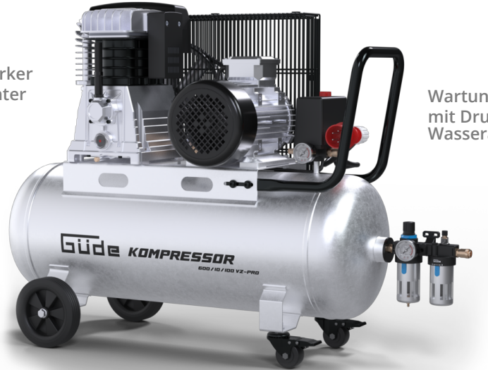
Wartungseinheit mit Druckminderer/ Wasserabscheider