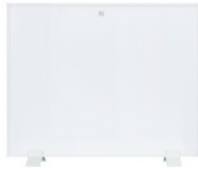
Frontansicht mit Standfuß

Sicherheit steht bei SHX an oberster Stelle. Das Heizpaneel ist mit einem Überhitzungsschutz versehen. So werden Risiken von vornherein unterbunden.