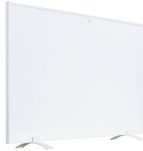
Schrägensicht mit Standfuß