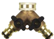
Art.Nr. 19766 2-Wege-Kupplung (Y-Stück) mit 2 Schließventilen