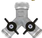
Art.Nr. 51990 Y-Verteiler mit 3/4"-Gewinde, verchromt