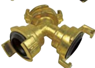
Art.Nr. 17589 Y-Verteiler