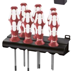
Art.Nr. 85118 Schraubenzieher-Satz, 7-teilig Wera