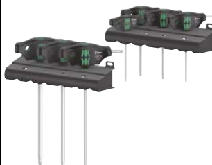
Art.Nr. 84818 T-Griff Torxsatz, 7-teilig Wera

Farbkennzeichnung nach Profilen (Grün = TORX®) und Größenstempelung