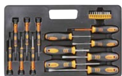
Art.Nr. 63587 Fein-Schraubendreher-Satz, 23-teilig PROFILINE

Inhalt: 4 x Schlitz: Gr. 4 x 75 / 5 x 75 / 6 x 100 / 8 x 150 2 x Phillips: Gr. 1 x 80 / 2 x 100 6 Elektriker-Schraubendreher: 3 x Schlitz: Gr. 2 / 2,5 / 3 und 3 x Phillips: Gr. PH 00 / 0 / 1 1 Stecknuss-Handgriff 10 Bits: Gr. T 10 / 15 / 20 / 25 / 30 / 40 und 6-kant: 3 / 4 / 5 / 6 mm