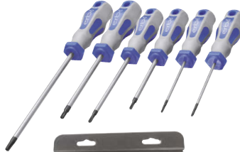
Art.Nr. 84052 Torx-Schraubenzieher-Satz, 6-teilig

• aus hochwertigem Chrom-Vanadium • mit Innenbohrung