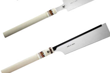
Art.Nr. 66276 Japansäge Douzuki