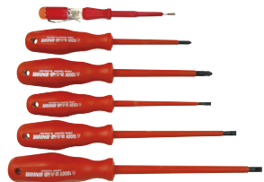
Art.Nr. 72329 Schraubenzieher-Satz, 6-teilig

VDE-geprüfte Spitzenqualität (Chrom-Vanadium)