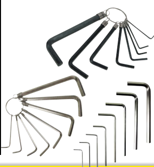
Art.Nr. 86807 Innensechskant-Schlüssel-Satz, 1,5 - 8 mm, 8-teilig erba