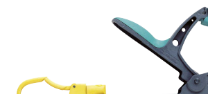
Art.Nr. 44808 Federzwinge, Type FZH 50