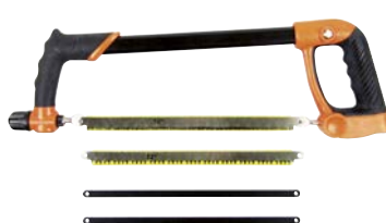
Art.Nr. 16286 4 in 1-Multifunktions-Sägebogen 300 mm lang, Sägeblatt auf 4 Winkel einstellbar: 45°, 90°, 135° und 180°, Drehknopf zur Feineinstellung der Sägeblatt-Spannung inkl. Sägeblatt-Aufbewahrungsfach und 4 Sägeblätter (sortiert)