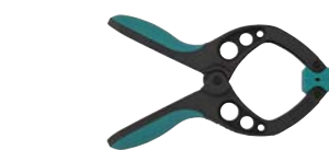
Art.Nr. 30909 Federzwinge 40 mm