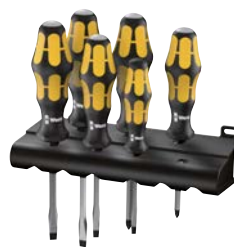
Art.Nr. 62618 Schraubenzieher-Satz Kraftform Plus 900, 6-teilig Wera

ideal zum Schrauben, Meißeln, Stemmen und Lösen feststehender Schrauben, durchgehende 6-Kant-Klinge mit Schlagkappe und Schlüsselhilfe, mit Black-Point-Spitze und Abrollschutz