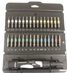
Art.Nr. 82918 Präzisions-Schrauber-Set, 32-teilig PROFILINE

Inhalt: 7 Schlitz: 1 / 1,5 / 2 / 2,5 / 3 / 3,5 / 4 mm 4 Phillips: PH000 / PH000 / PH0 / PH1 2 Pozidrive: PZ0 / PZ1, 9 Torx: TX4 / TX5 / TX6 / TX7 / TX8 / TX9 / TX10 / TX15 / TX20 8 Innensechskant: 0,7 / 0,9 / 1,3 / 1,5 / 2 / 2,5 / 3 / 4 mm 1 Bit-Schrauber, teleskopierbar 1 flexible Welle