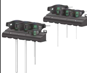
Art.Nr. 84718 T-Griff Innensechskant-Schlüsselsatz, 7-teilig Wera

Farbkennzeichnung nach Profilen (Blau = Innensechskant) und Größenstempelung