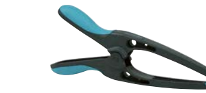
Art.Nr. 42408 Spitzfederzwinge MT 70