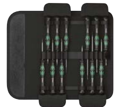
Art.Nr. 68718 Elektroniker-Micro-Schraubenzieher-Satz, 12-teilig Wera

Inhalt: 5 x Schlitz: 1,5 x 40 / 1,8 x 60 / 2 x 60 / 2,5 x 80 / 3 x 80 mm 2 x Phillips: PH00 x 60 / PH0 x 60 mm 2 x Torx: TX5 x 40 / TX6 x 40 mm 3 x Innensechskant: 0,9 x 40 / 1,5 x 60 / 2 x 60 mm