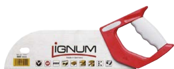
Art.Nr. 33422 Fourniersäge, 320 mm mit besonderen Qualitätsmerkmalen: Zähne: präzisionsgeschärft, ausgeschliffen / Kreuzschliff, zusätzlich mit Patent-Hohl Schliff versehen - dadurch für alle Holzarten bestens geeignet, kein Springen beim Ansägen, glatte, faserfreie Schnittflächen, bleiben durch induktiv gehärtete Zähne 5-mal länger scharf, 12 Zähne pro Zoll, komplett mit Zahnschutzleiste, 2-Komponenten-Komfort-Handgriff aus schlagfestem Kunststoff, mit Anschlagwinkel 45° und 90°