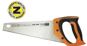
2-seitig geschliffenes Sägeblatt aus Manganstahl, hochfrequenzgehärtet und poliert, mit Anschlagwinkel 45° und 90°