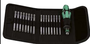
Art.Nr. 55718 Bit-Schraubenzieher-Satz KK 60, 17-teilig Wera

Inhalt: 16 Bits, 89 mm lang: 5 x Torx mit Innenbohrung: TX10 / TX15 / TX20 / TX25 / TX30, 3 x Phillips: PH1 / PH2 / PH3 3 x Pozidrive: PZ1 / PZ2 / PZ3, 4 x Innensechskant: 3 / 4 / 5 / 6 mm, 1 x Schlitz: 5,5 mm