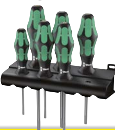
Art.Nr. 57718 Schraubenzieher-Satz Kraftform Plus 300, 6-teilig Wera

mit Lasertip für besseren Halt in der Schraube und Abrollschutz