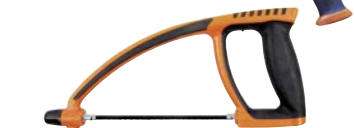
Art.Nr. 16186 Mini-Multifunktions-Handsäge 150 mm lang, Sägeblatt auf 3 Winkel einstellbar: -45°, 90° und +45°, Drehknopf zur Feineinstellung der Sägeblatt-Spannung