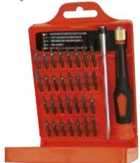
Art.Nr. 64487 Präzisions-Schraubenzieher-Satz, 32-teilig PROFILINE

Inhalt: 30 Bits: 9 x Torx, 4 x Phillips, 2 x Pozidrive, 7 x Schlitz, 8 x Hex, 1 Verlängerung, 120 mm und 1 Griff