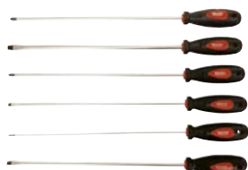
Art.Nr. 21684 Schraubenzieher-Satz 450 mm, 6-teilig WALTER

• aus Chrom-Vanadium, 450 mm lang (325 mm ohne Griff), mit 2 Komponenten-Griff