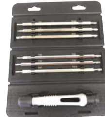
Art.Nr. 82818 Präzisions-Schrauber-Set, 13-teilig

Inhalt: 6 Doppelbits, 120 mm lang: 3 Schlitz: 2,0 mm x PH00 / 2,5 mm x PH0 / 3,0 mm x PH1 3 Torx: TX5 x TX8 / TX6 x TX9 / TX7 x TX10 1 Bit-Schrauber, teleskopierbar