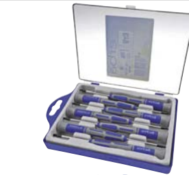
Art.Nr. 91552 Torx-Fein-Schraubenzieher-Set, 7-teilig