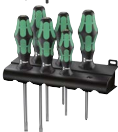
Art.Nr. 57618 Schraubenzieher-Satz Kraftform Plus 300, 6-teilig Wera

mit Lasertip für besseren Halt in der Schraube und Abrollschutz