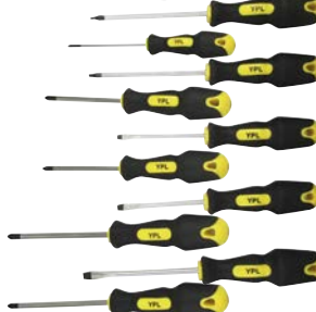
Art.Nr. 50686 Schraubenzieher-Satz, 10-teilig

Klingen aus Chrom-Vanadium, mit brünierten Spitzen