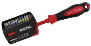
Art.Nr. 26332 VDE-Schraubenzieher-/Bits-Box, 14-teilig

Inhalt: 12 Bits aus S2-Stahl 2 Bit-Halter (einer davon isoliert)