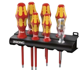
Art.Nr. 72818 VDE-Schraubenzieher-Satz, 7-teilig

vollisoliert, bis 1.000 V, mit Lasertip für besseren Halt in der Schraube und Abrollschutz