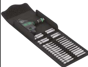
Art.Nr. 84918 T-Griff Schrauber-Satz, 17-teilig Wera

Inhalt: 1 Handhalter 416 R Quergriff mit Schnellwechselfutter Rapidaptor 1/4" x 45, 2 Phillips: 2 x 89 / 3 x 89 2 Pozidrive: 2 x 89 / 3 x 89, 6 Torx: 10 x 89 / 15 x 89 / 120 x 89 / 25 x 89 / 30 x 89 / 40 x 89 5 Hex: 3,0 x 89 / 4,0 x 89 / 5,0 x 89 / 6,0 x 89 / 8,0 x 89 sowie 1,0 x 5,5 x 89