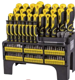
Art.Nr. 42584 XXL-Schraubenzieher-/Bits-Satz, 100-teilig PROFILINE

Inhalt: 23 Schraubenzieher, sortiert 8 Präzisions-Schraubenzieher 1 Ratschen-Schraubenzieher mit Bit-Aufnahme 2 Winkel-Schraubenzieher 6 Stecknüsse 60 Chrom-Vanadium-Bits, 25 mm