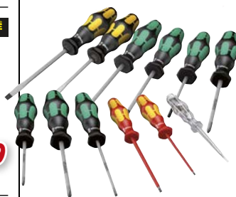
Art.Nr. 61118 XXL-Schraubenzieher-Satz Kraftform, 12-teilig Wera

Inhalt: 2 Profi-Schraubenzieher mit Schlagkappe und 6-Kant-Klinge: 5,5 x 100 / 7 x 125 mm 7 Schraubenzieher mit Lasertip: PH2 x 100 / PZ1 x 80 / PZ2 x 100 / PZ4 x 100 / T15 x 80 / T20 x 100 / T25 x 100 2 VDE-Schraubenzieher, vollisoliert, bis 1.000 V: 2,5 x 80 / 3,5 x 100 mm und 1 Spannungsprüfer: 3 x 70 mm