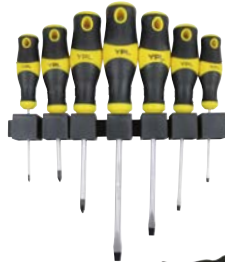
Art.Nr. 99451 Schraubenzieher-Satz, 8-teilig