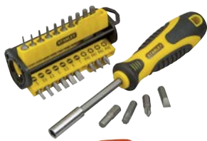
Art.Nr. 22720 Bit-Schraubenzieher-Set, 34-teilig STANLEY

Inhalt: 1 Schraubenziehergriff mit Magnet-Bithalter und 33 CV-Bits, 11 x Torx: TX5 / TX6 / TX7 / TX8 / TX10 / TX15 / TX20 / TX25 / TX27 / TX30 und TX40, 6 x Phillips: PH0 / 2x PH1 / 2 x PH2 und PH3, 9 x Innensechskant: 1/16" / 5/64" / 3/32" / 1/8" / 5/32" / 3/16" / 1/4" / 5/16" und 9/32" sowie 7 x Schlitz: 3 / 3,5 / 4,5 / 5 / 5,5 / 6 und 7 mm