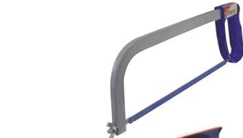
Art.Nr. 2407 Metallsägebogen inkl. Sägeblatt 300 mm