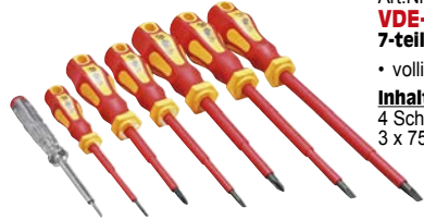
Art.Nr. 84152 VDE-Schraubenzieher-Satz, 7-teilig