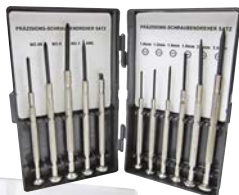
Art.Nr. 98907 Uhrmacher-Schrauber-Set, 11-teilig

Inhalt: 3 Kreuz-Schraubenzieher, Größe: 00 / 0 und 1 6 Schlitz-Schraubenzieher: 1, 1,2, 1,4, 1,8, 2,4 und 3 mm, 1 Ahle und 1 Magnetheber