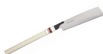
Art.Nr. 38850 Präzisions-Gehrungssäge