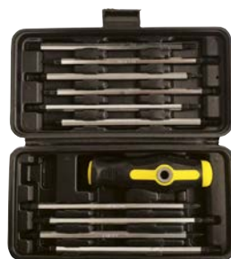
Art.Nr. 57786 Doppelklingen-Schraubenzieher-Satz, 11-teilig

Inhalt: 10 Doppelend-Bits, 175 mm - extra lang!, aus Chrom-Vanadium, mit brüniertem Magnet-Spitze, bestehend aus: 3 Stk. Torx: TX10 - TX15 / TX20 - TX25 und TX30 - TX40, 1 Stk. Phillips: PH1 - PH2, 1 Stk. Pozidriv: PZ1 - PZ2, 3 Stk. Innensechskant: 4 / 5 und 6 mm und 2 Stk. Schlitz: 4 - 6 mm und 5 - 7 mm sowie 1 Umsteck-Handgriff (auch als T-Griff verwendbar), komplett in schwarzer Kunststoff-Kassette