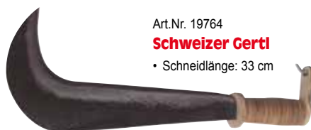
Art.Nr. 19764 Schweizer Gerti • Schneidlänge: 33 cm