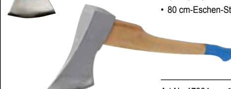
Art.Nr. 34497 1.600 g • 80 cm-Eschen-Stiel