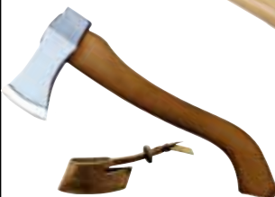
Art.Nr. 66218 Wikinger-Beil, 300 g • 32 cm-Buchen-Stiel • geschmiedet • polierte Schneide • Klingenschutz aus Rindsleder