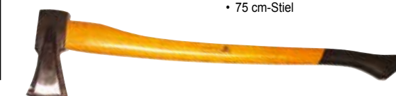
Art.Nr. 6006 2.000 g • 75 cm-Stiel