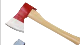
Art.Nr. 10913 800 g • 32 cm-Stiel • Nagelzieher