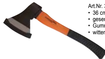
Art.Nr. 31352 600 g • 36 cm-Fiberglas-Stiel • gesenkgeschmiedet • Gummi-Handgriff • witterungsunempfindlich