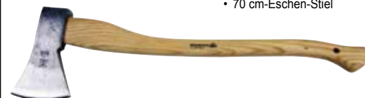
Art.Nr. 17064 1.250 g • 70 cm-Eschen-Stiel