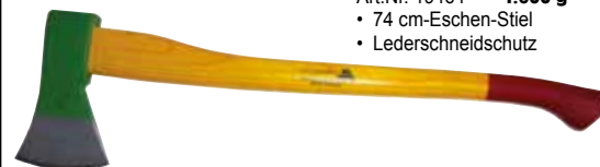
Art.Nr. 19464 1.600 g • 74 cm-Eschen-Stiel • Lederschneidschutz