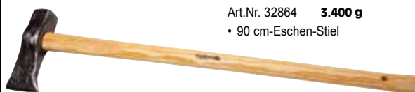
Art.Nr. 32864 3.400 g • 90 cm-Eschen-Stiel