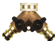
Art.Nr. 19766 2-Wege-Kupplung (Y-Stück) mit 2 Schließventilen