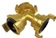
Art.Nr. 17589 Y-Verteiler