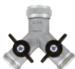
Art.Nr. 51990 Y-Verteiler mit 3/4"-Gewinde, verchromt