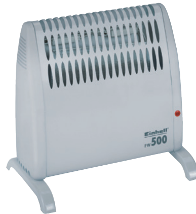
Art.Nr. 70630 Type FW 500

heizt automatisch bei Temperaturen unter ca. +5° C bis +8° C, besonders gut geeignet für kleine Räume ohne eigene Heizung wie Keller, Vorratsräume, Werkstätten und Wintergärten