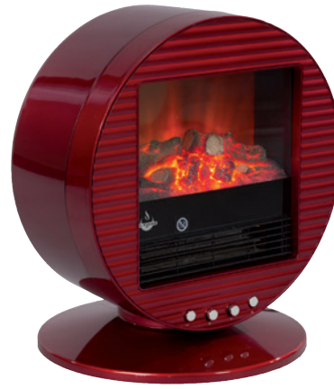
Art.Nr. 1032 Elektrokramin "Mannheim"