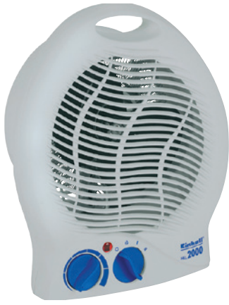
Art.Nr. 38430 Heizlüfter HKL 2000