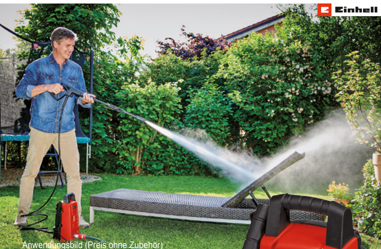
Anwendungsbild (Preis ohne Zubehör)