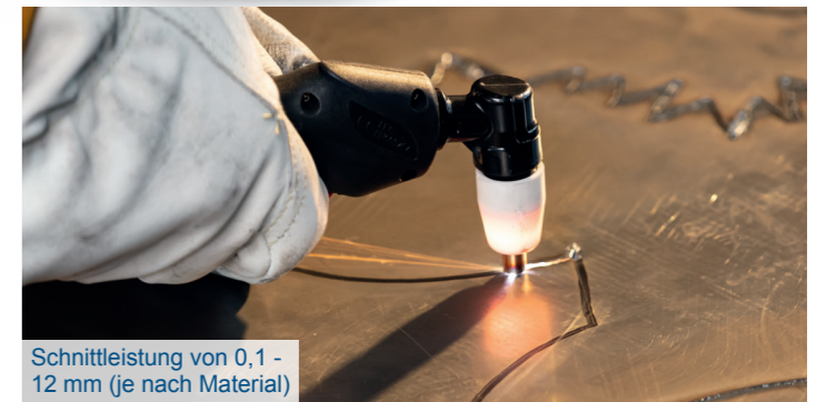
Schnittleistung von 0,1 - 12 mm (je nach Material)