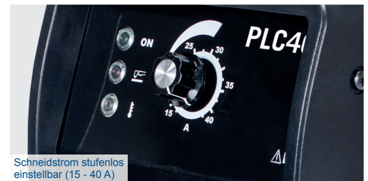
Schneidstrom stufenlos einstellbar (15 - 40 A)