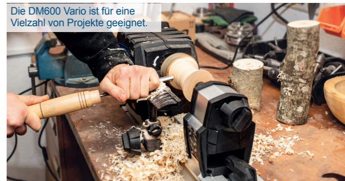
Die DM600 Vario ist für eine Vielzahl von Projekten geeignet.

Stufenlose Drehzahl Verstellbar von 800 – 3000 U/min