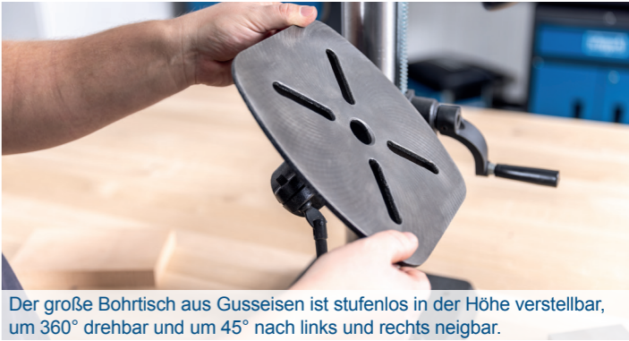
Der große Bohrtisch aus Gusseisen ist stufenlos in der Höhe verstellbar, um 360° drehbar und um 45° nach links und rechts neigbar.