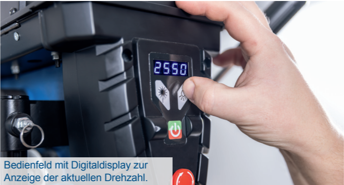
Bedienfeld mit Digitaldisplay zur Anzeige der aktuellen Drehzahl.