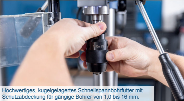
Hochwertiges, kugelgelagertes Schnellspannbohrfutter mit Schutzabdeckung für gängige Bohrer von 1,0 bis 16 mm.