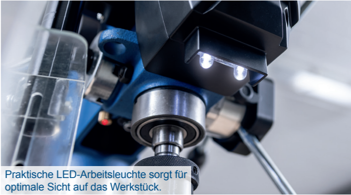
Praktische LED-Arbeitsleuchte sorgt für optimale Sicht auf das Werkstück.