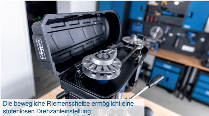
Die bewegliche Riemenscheibe ermöglicht eine stufenlosen Drehzahleinstellung.