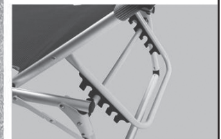
5-fach verstellbare Rückenlehne

WICHTIG! Gebrauchsanleitung für spätere Verwendung aufbewahren und vor Gebrauch sorgfältig lesen.