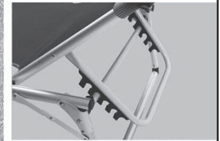
5-fach verstellbare Rückenlehne

WICHTIG! Gebrauchsanleitung für spätere Verwendung aufbewahren und vor Gebrauch sorgfältig lesen.