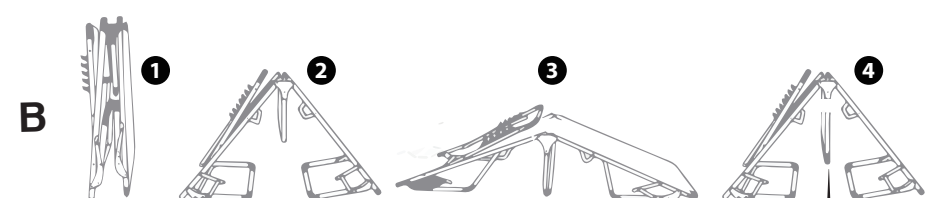
vor dem Falten den Standfuß hinunter ziehen